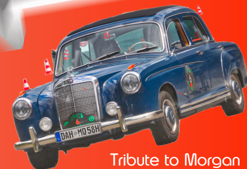
Tribute to Morgan